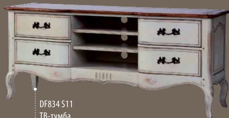
DF834 S11 ТВ-тумба 158 X 48 X 69