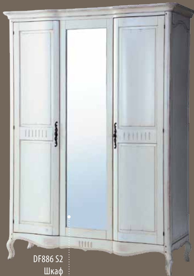
DF886 S2 Шкаф 161 X 62.5 X 220