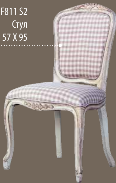
DF811 S2 Стул 54 X 57 X 95