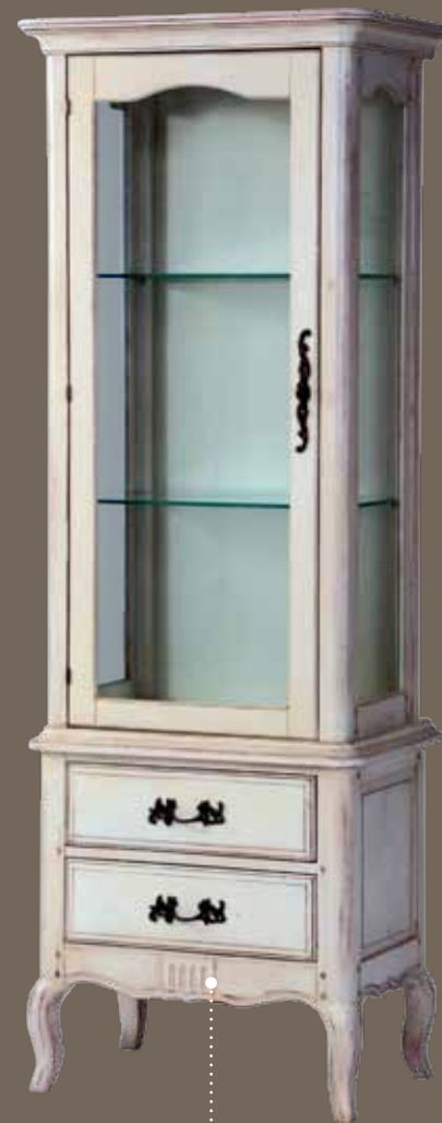
DF860L-3S2 Сервант 70.5 X 46.3 X 180