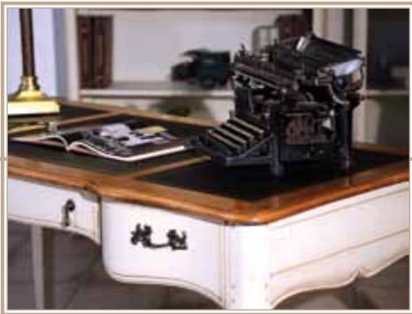
Кабинеты 22 - 27 см.