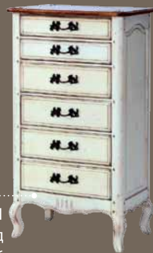
DF821 S11 Комод 66 X 44.5 X 116