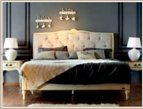
Спальни 2 - 9 см.