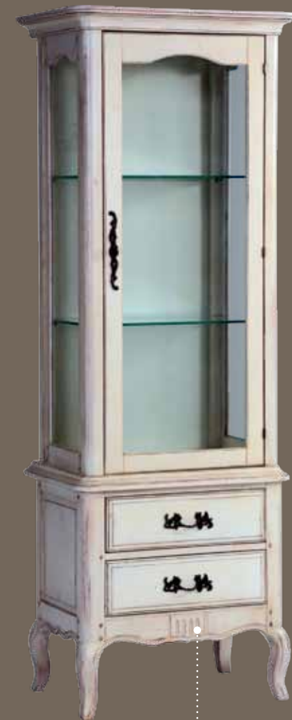
DF860R-3S2 Сервант 70.5 X 46.3 X 180