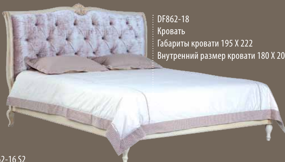
DF862-18 Кровать Габариты кровати 195 X 222 Внутренний размер кровати 180 X 200