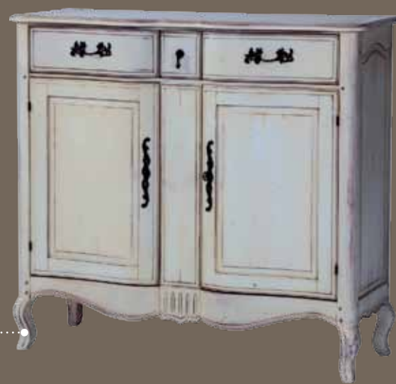
DF873 S2 Тумба для обуви 120 X 42 X 108