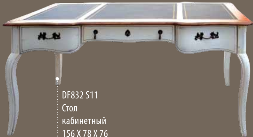
DF832 S11 Стол кабинетный 156 X 78 X 76