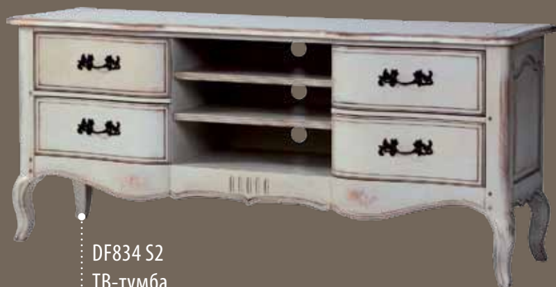
DF834 S2 ТВ-тумба 158 X 48 X 69