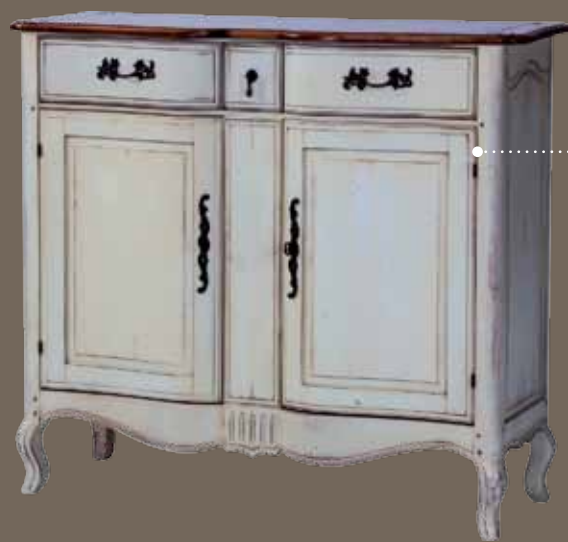
DF873 S11 Тумба для обуви 120 X 42 X 108