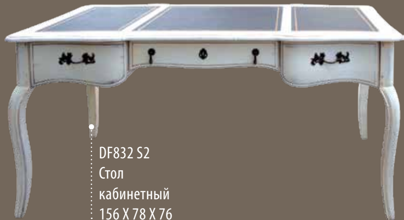
DF832 S2 Стол кабинетный 156 X 78 X 76