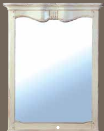
DF816 S2 Зеркало 89.6 X 9.5 X 111.5