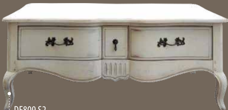
DF809 S2 Кофейный столик 122 X 80 X 49