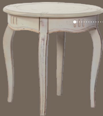
DF855 S2 Кофейный столик DIA. 60 X 60