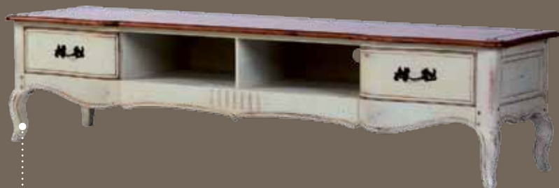
DF833 S11 ТВ-тумба 210 X 54 X 49