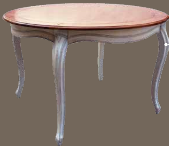
DF877 S11 Стол обеденный DIA. 120 X 77